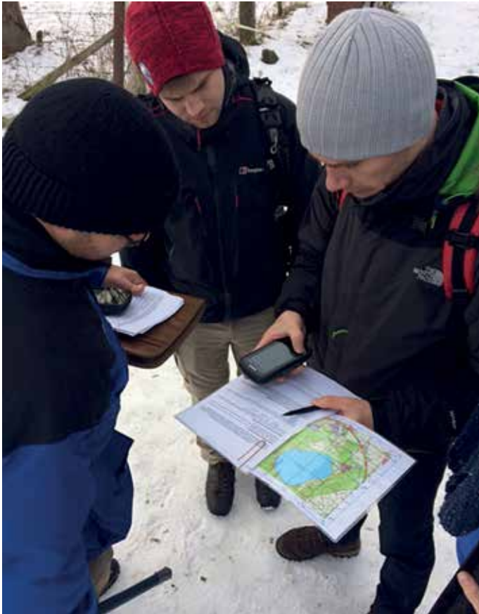
▲ Abb. 2: Übungen zur Geodäsie während der Exkursion in die Vulkaneifel

und Notfallhilfe. Themen sind Öffentliche Gesundheit (Public Health), Struktur der Rettungsdienste und der klinischen Versorgung, Katastrophenmedizin im internationalen und nationalen Kontext sowie Psychosoziale Notfallhilfe (PSNV), wobei aktuelle Problemfelder erörtert werden.