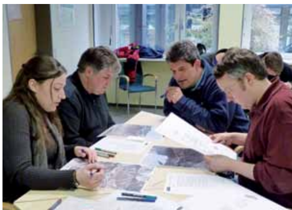
Gruppenarbeit und Übung zur Naturgefahrenanalyse

Master anschließt, sondern in den Beruf einsteigt, hat zu einem späteren Zeitpunkt die Möglichkeit einen Master wie KaVoMa zu absolvieren, ohne aus dem Job aussteigen zu müssen. Die Berufserfahrung ist für ein Weiterbildungsstudium sogar eine wichtige Voraussetzung und muss mindestens ein Jahr, oder wie bei KaVoMa mindestens drei Jahre, betragen.