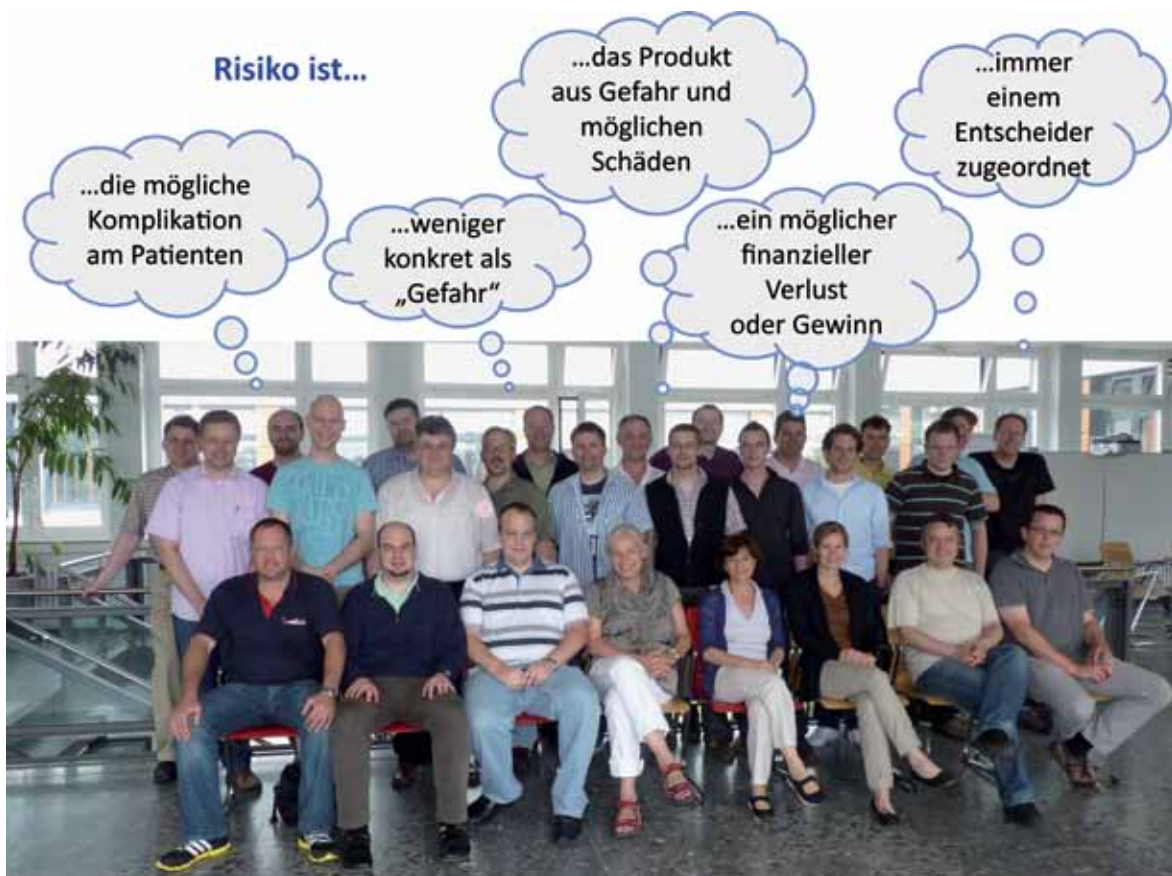
6. Studienjahrgang KaVoMa: Vielfalt der Risikosichten

mie, schnell an ihre Grenzen stoßen. Der Bevölkerungsschutz sieht sich heute vielfältigen Risiken gegenübergestellt, deren Auswirkungen weit in unsere gesellschaftlichen Strukturen hineinreichen können. So vielfältig und weitreichend die Auswirkungen, so unterschiedlich sind auch die möglichen Ursachen. Für das Beispiel des Stromausfalls reichen sie vom terroristischen Cyberanschlag bis hin zu unterschiedlichen Naturgefahren wie Dürre und Hochwasser. Es braucht also sehr unterschiedliche Expertisen und Akteure die ihrerseits fachübergreifend denken, um sowohl mögliche Ursachen als auch Auswirkungen z. B. im Rahmen einer „Risikoanalyse Stromausfall“ zu identifizieren, zu analysieren und entsprechende vorsorgende Maßnahmen abzuleiten und umzusetzen. Hinzu kommt die Verzahnung von Vorsorge, Bewältigung und Wiederaufbau (s. „Katastrophenkreislauf“), sowie eine Verknüpfung der spezifischen Fragestellungen innerhalb dieser drei Bereiche.