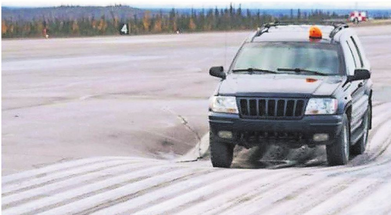
Im kanadischen Inuvik haben auftaubedingte Bodensetzungen zu starken Beschädigungen der Landebahn geführt.

Schrott: Wir haben bis heute nicht einmal eine genaue Karte mit der globalen Verteilung von Permafrost, geschweige denn konkrete Werte zu dessen Schwund. Dafür sind die Einflussfaktoren räumlich zu variabel. Wir versuchen derzeit hier am Institut mit einem Forschungsprojekt in den semiariden Anden auf der Höhe von Santiago de Chile erst einmal zu ermitteln, wie viel Eis dort überhaupt im Untergrund versteckt ist. Einige spannende Untersuchungen zeigen grundsätzlich, dass die Permafrostgrenze in Richtung der Pole wandert. Bis zum Jahr 2100 können das durchaus einige hundert Kilometer werden. In den Gebirgen taut der Permafrost an den Nordhängen in tieferen Lagen. An den Südseiten gibt es ohnehin nur